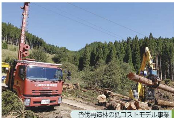
皆伐再造林の低コストモデル事業