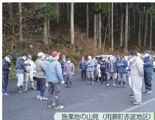
施業地の山見（用瀬町赤波地区）

併せて、事業の本質である地域の森林管理の担い手として、森林を整備し健全な森林として守るべく森林整備に取り組んでいきます。