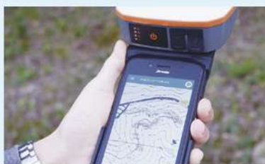
PDA と GPS による測量情報の「見える化」

八頭中央森林組合では、いち早く取り組みを進めており、県が行っている航空レーザー計測のデータを利用して GIS、GPS 測量、ドローンによる写真解析など組合員の皆様の所有森林の「見える化」を図っています。県市町と協力して、より精度の高い情報を提供していきます。