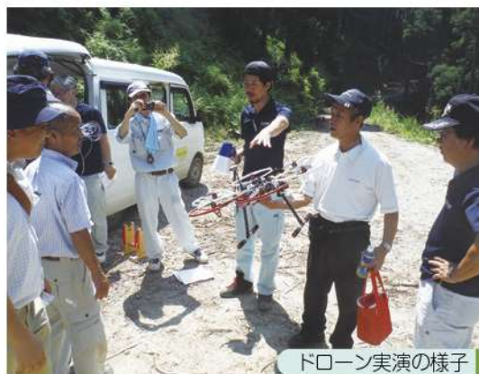
ドローン実演の様子

この度、八頭町船岡地内におきまして、小規模な皆伐再造林事業を行います。針葉樹から広葉樹への樹種展開をはかり、「伐って」、「使って」、「植える」という森林資源の循環的利用を進めながら、適切な森林管理による持続可能な林業の実現を目指していきたく思います。また、更新伐を行い針葉樹と広葉樹の針広混交林へと転換し、森林の水源涵養としての機能を増進する森林を育てていきたくと思っています。