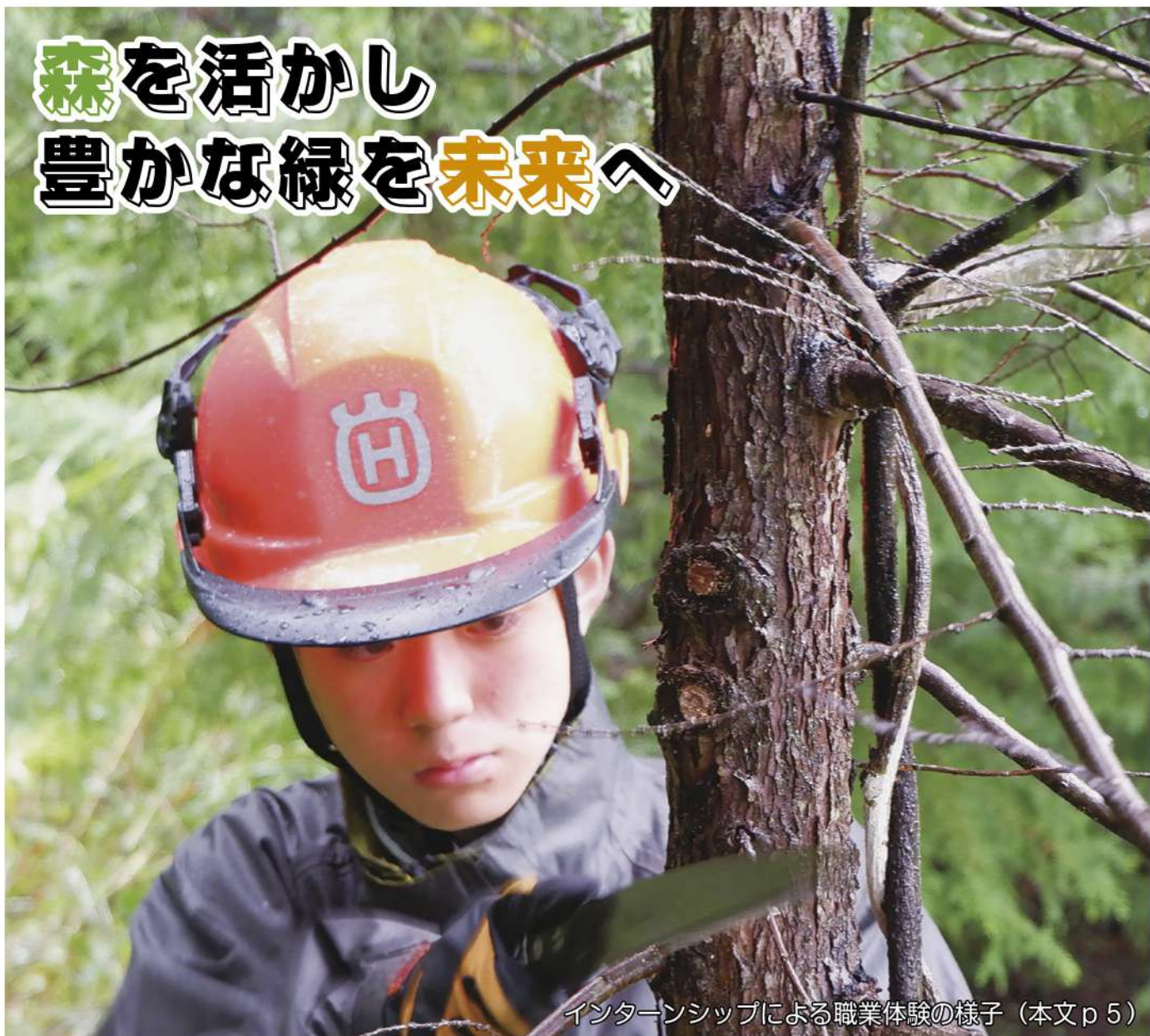
インターンシップによる職業体験の様子 (本文 p5)