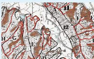
GIS による多様な地図情報の「見える化」