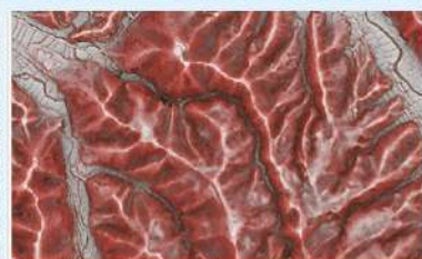
レーザー航測による地形の「見える化」